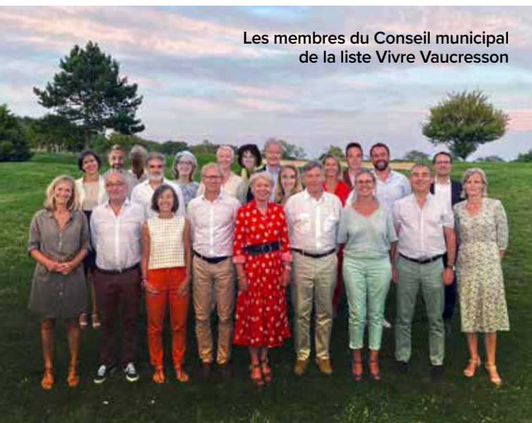
Les membres du Conseil municipal de la liste Vivre Vaucresson

La réunion publique de mi-mandat du 18 septembre à La Montgolfière sera l'occasion d'aborder ensemble ces sujets. ■