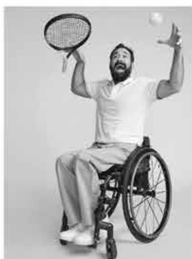
MICHAËL JEREMIASZ TENNIS FAUTEUIL