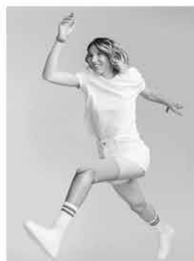
MARIE-AMÉLIE LE FUR PARA ATHLÉTISME