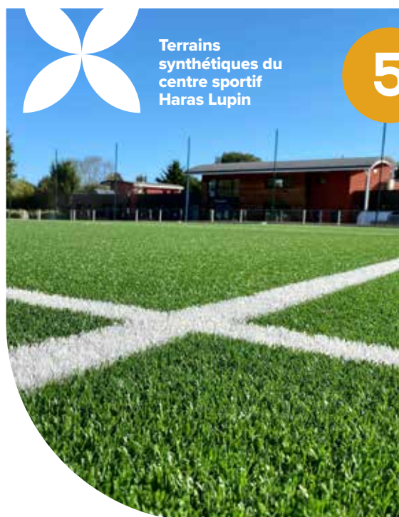
Terrains synthétiques du centre sportif Haras Lupin