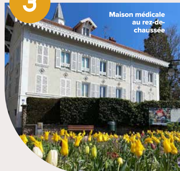
Maison médicale au rez-de-chaussée