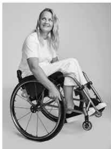
PERLE BOUGE PARA AVIRON