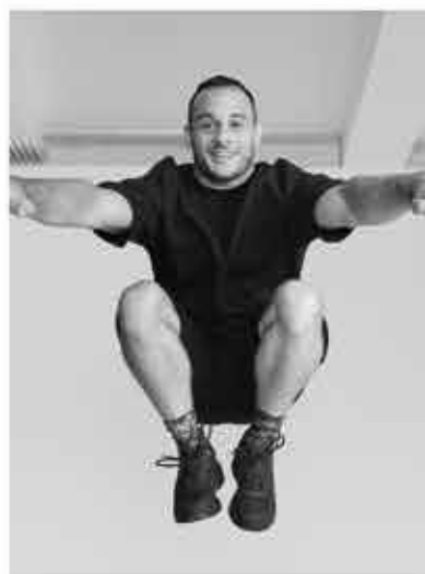
SAMIR AÏT SAÏD GYMNASTIQUE