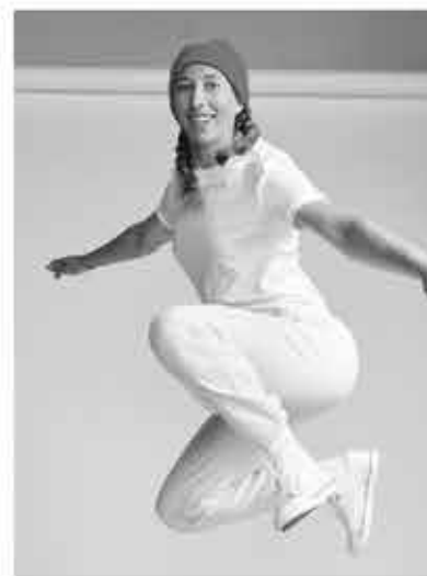
CHLOÉ TRESPEUCH SNOWBOARD