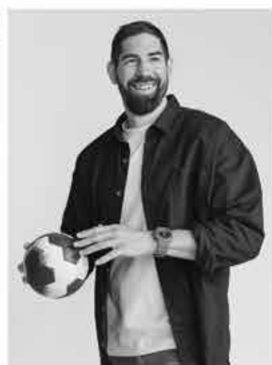
NIKOLA KARABATIC HANDBALL