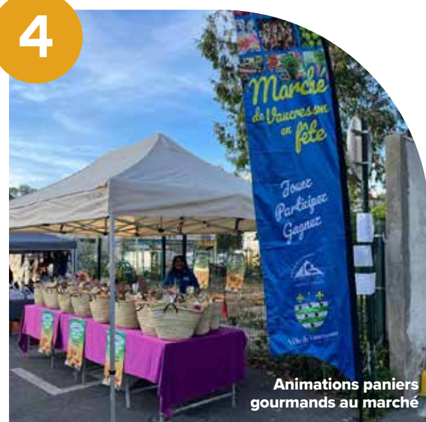
Animations paniers gourmands au marché