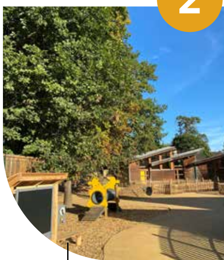
Cour Oasis de l'école maternelle des Grandes Fermes